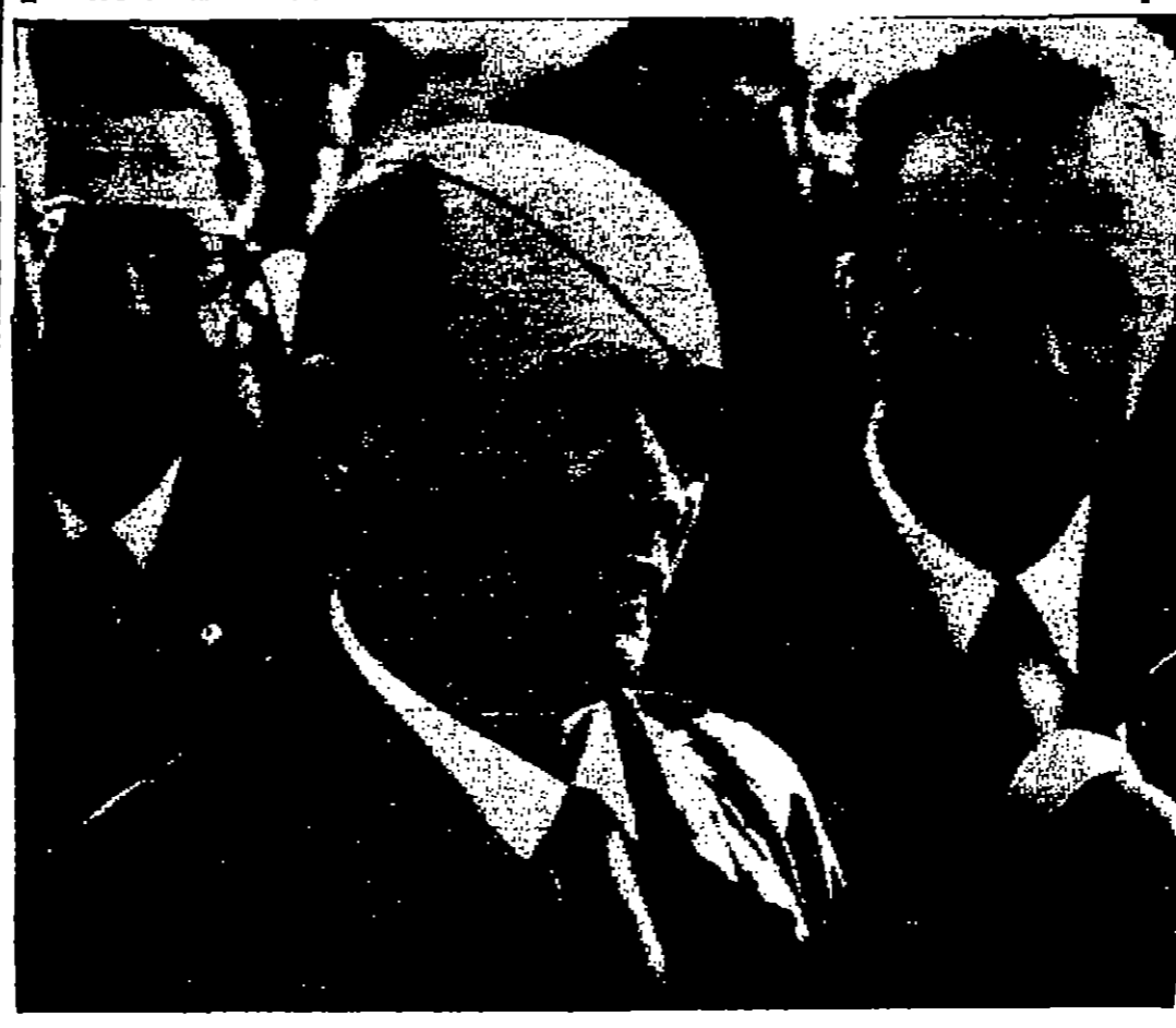
وزير الدفاع الإسرائيلي موشيه دايان وهو يولي بيبته لدى وصوله الى مطار كيبتي الدولي في نيويورك (صورة تأسست من الميديا تيرست).

بيروت - استقبل السيد حسين العمري وزير الخارجية اللبنانية السناتور الأمريكي جاك ميلر في مجلس الشيوخ الأمريكي لدى توقيعه في بيروت في طريق عودته من جولة في الشرق الاوسط وقد تركزت اجتهادها حول أزمة الشرق الاوسط.